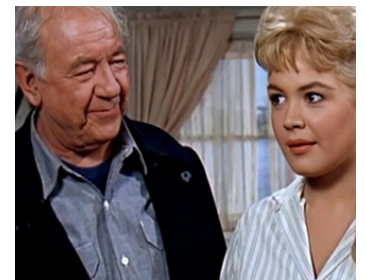
1961 LES LYCÉENNES (Tammy Tell Me True) d'Harry Keller avec Sandra Dee