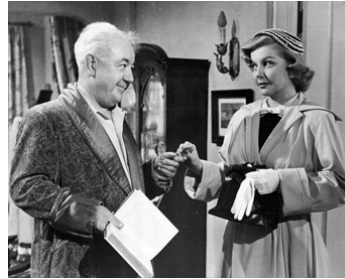
1952 JUST ACROSS THE STREET de Joseph Pevney avec Ann Sheridan