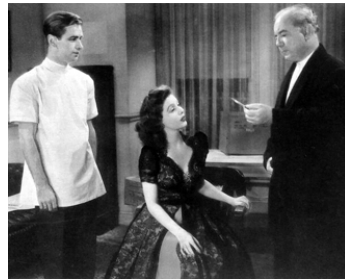
1944 LE BONHEUR EST POUR DEMAIN (And Now Tomorrow) d'I. Pichel avec A. Ladd, L. Young