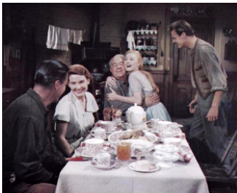
1955 MÉLODIE INTERROMPUE (Interrupted Melody) de C. Bernhardt avec Eleanor Parker