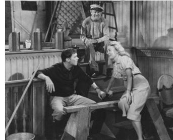
1953 CRUISIN' DOWN THE RIVER de Richard Quine avec Dick Haymes, Audrey Totter