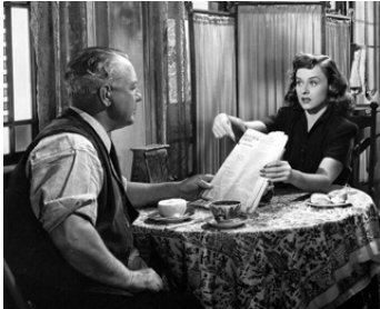
1943 LA BOULE DE CRISTAL (The Crystal Ball) d'Elliott Nugent avec Paulette Goddard