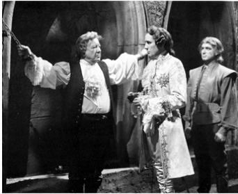
1951 LE CHEVALIER AU MASQUE DE DENTELLES de Lesley Selander avec Victor Jory