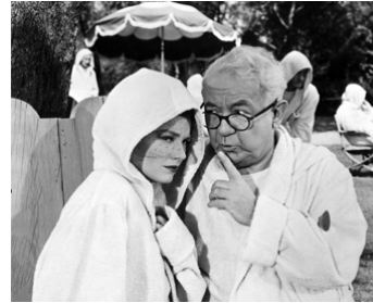
1952 SEULES LES FEMMES SAVENT MENTIR (My Wife's Best Friend) de R. Sale avec A. Baxter