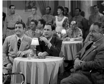
1943 DEUX NIGAUDS DANS LE FOIN (It ain't hay) d'E. Kenton avec B. Abbott et L. Costello