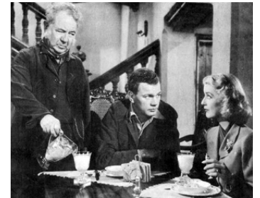
1945 LE POIDS D'UN MENSONGE (Love Letters) de W. Dieterle avec J. Cotten, Ann Richards