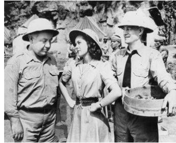
1940 LA MAIN DE LA MOMIE (The Mummy's Hand) de Ch. Cabanne avec Peggie Moran