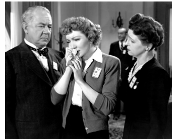
1944 UNE FEMME SUR LES BRAS (Practically Yours) de M. Leisen avec C. Colbert, I. Withers