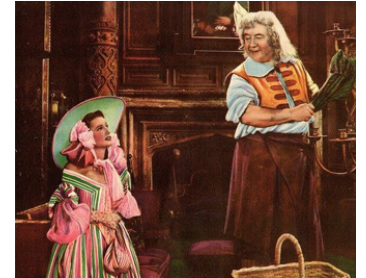
1944 L'AVENTURE VIENT DE LA MER (Frenchan's Creek) de Mitchell Leisen avec Joan Fontaine