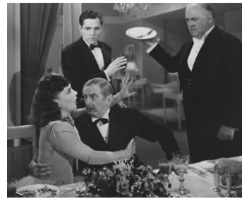
1939 MEXICAN SPITFIRE de Leslie Goodwins avec Lupe Velez, Donald Woods, Leon Errol