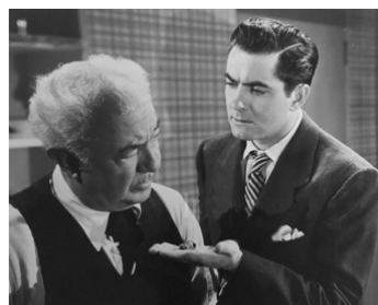
1948 L'ÉNIGMATIQUE M. HORACE (The Luck of the Irish) d'H. Koster avec Tyrone Power