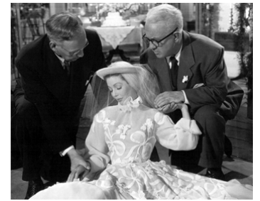
1951 MADAME SORT À MINUIT (Half Angel) de Richard Sale avec Loretta Young