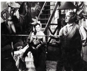
1945 LA DUCHESSE DES BAS-FONDS (Kitty) de Mitchell Leisen avec Paulette Goddard