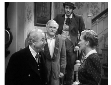
1946 THE COCKEYED MIRACLE de S. Sylvan Simon avec F. Morgan, K. Wynn, Gl. Cooper