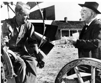
1958 LE FIER REBELLE (The Proud Rebel) de Michael Curtiz avec Alan Ladd