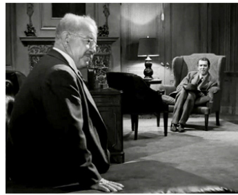
1950 HARVEY (Harvey) d'Henry Koster avec James Stewart