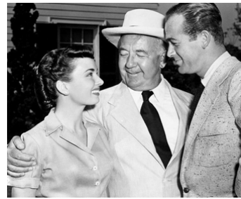
1951 KATIE DID IT de Frederick De Cordova avec Ann Blyth, Mark Stevens