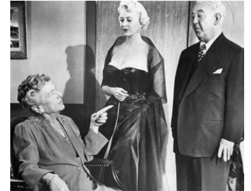
1953 PARIS MODEL (Paris Model) d'Alfred E. Green avec Marilyn Maxwell