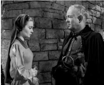
1953 LA REINE VIERGE (Young Bess) de George Sidney avec Jean Simmons