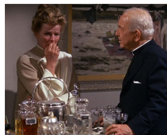
1967 DEVINE QUI VIENT DÎNER (Guess who's coming to Dinner) de S. Kramer avec K. Hepburn