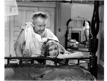
1942 MA FEMME EST UNE SORCIÈRE (I married a Witch) de René Clair avec Veronica Lake