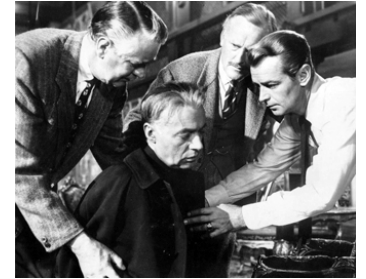
1952 TONNERRE SUR LE TEMPLE (Thunder in the East) de Ch. Vidor avec C. Boyer, A. Ladd