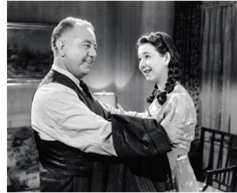
1941 ÂGE INGRAT (Small Town Deb) d'Harold D. Schuster avec Jane Withers