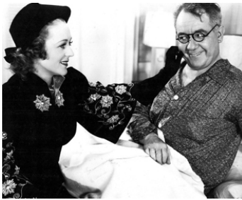
1938 EVERYBODY'S DOING IT de Christy Cabanne avec Sally Eilers