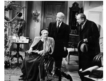
1957 JOHNNY LA BAGARRE (Johnny Trouble) de J. Auer avec Ethel Barrymore, Jesse White