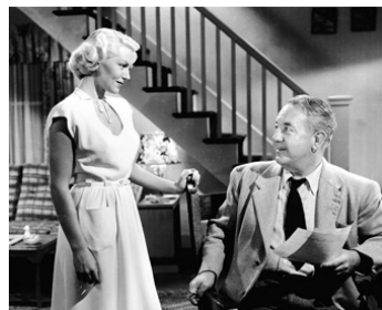
1946 LE FACTEUR SONNE TOUJOURS 2 FOIS (The Postman...) de Tay Garnett avec L. Turner