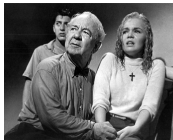
1960 LA VIE PRIVÉE D'ADAM ET ÈVE d'Albert Zugsmith avec P. Anka, Tuesday Weld