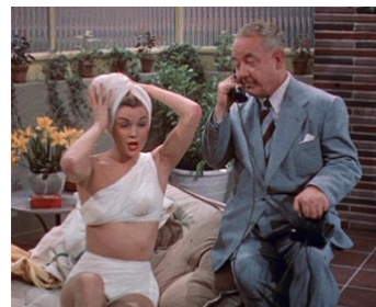
1946 ÈVE ÉTERNELLE (Easy to Wed) d'Edward Buzzell avec Esther Williams