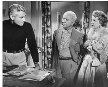
1955 LA MAISON SUR LA PLAGE (Female on the Beach) de J. Pevney avec J. Chandler, N. Schafer