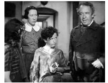
1939 LES HAUTS DE HURLEVENT (Wuthering Heights) de W. Wyler avec F. Robson, D. Scott