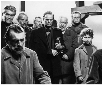
1949 LES MARINS DE L'ORGUEILLEUX d'Henry Hathaway avec R. Widmark, Dean Stockwell