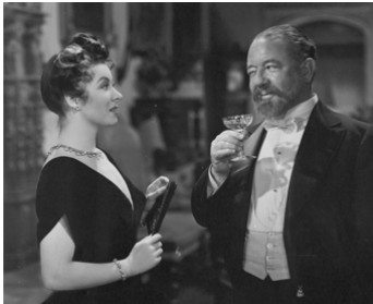
1944 MADAME PARKINGTON (Mrs Parkington) de Tay Garnett avec Greer Garson