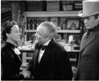
1940 LA MAISON AUX 7 PIGNONS (The House of the 7 Gables) de J. May avec M. Lindsay, G. Sanders