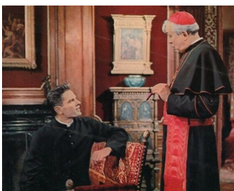
1963 LE CARDINAL (The Cardinal) d'Otto Preminger avec Tom Tryon