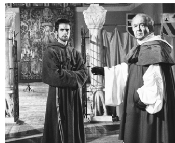
1961 FRANÇOIS D'ASSISE (Francis of Assisi) de Michael Curtiz avec Bradford Dillman