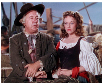
1947 LES CONQUÉRANTS D'UN NOUVEAU MONDE (Unconquered) de C. DeMille avec P. Goddard