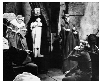
1948 JEANNE D'ARC (Joan of Arc) de Victor Fleming avec Francis L. Sullivan, I. Bergman