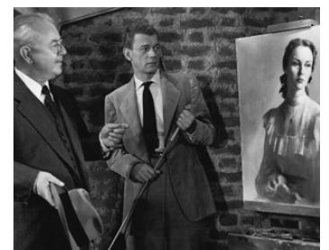
1948 LE PORTRAIT DE JENNIE (Portrait of Jennie) de William Dieterle avec Joseph Cotten